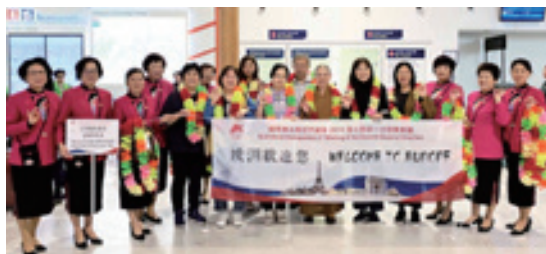
▲2019 巴黎理事會機場迎賓。