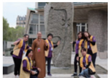
▲聯合國教科文組織開會。