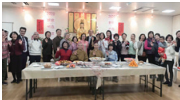
▲ 1月3日新宿分會新春茶話會，有42位幹部會員參加，輔導法師覺耀法師邀請來日講座的依來法師與眾開示結緣，依來法師說明參加佛光會的好處、佛光會的組織架構，分會如人的雙腳，多辦活動走出去；鼓勵會員會友都參與，要有「缺我不可」的決心，為自己定位。茶話會並有走秀、新春拜年、祈願及未來展望分享等。