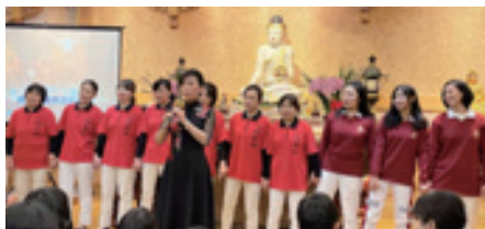
▲演唱人間音緣歌曲「點燈」。