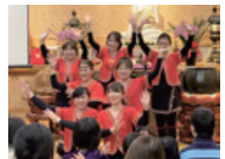
▲台灣原住民舞蹈「站在高崗上」。