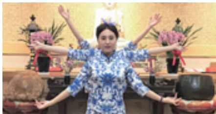
▲「來生願做一朵蓮」旗袍秀。