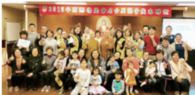
（右圖）歲末聯誼表演、抽獎得獎者合影。