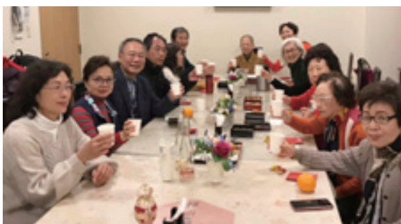
▲ 1月4日港區分會舉行新春茶話會，有會員、會友12人參與，大家先互相拜年，並一人說一句祝福的話供養大家，覺智法師也請大家不追憶過去，而是要重視當下，創造未來，希望大家都能福滿人間。