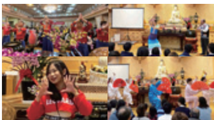
▲右上：月光下的鳳尾竹。 左上：青空太極拳會跳廣場舞。 右下：太極扇「中國功夫」。 左下：年街舞。